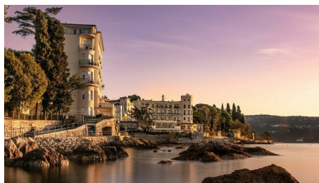
Adria Relax Resort – Genusstage in Opatija

"Genusstage in Opatija", das bedeutet ganz einfach, das kaiserliche Flair des ehemaligen österreichischen k.u.k.-Seebades Abbazia zu genießen. Nicht in irgendeinem Hotel, sondern im Miramar, das in Bewertungsportalen als Gesamtkunstwerk bezeichnet wird. Erwarten Sie in diesem Hotel genussvolle Urlaubsfreuden par excellence wegen der herausragend guten Küchenqualität, der großzügigen Wellnessoase, der tollen Lage am Meer und wegen der gemütlichen Zimmer.