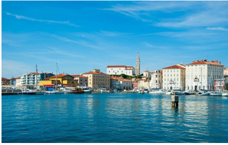
Entspannte Tage im Rosenhafen

Portoroz – "Rosenhafen" ist schon seit sehr vielen Jahren als Kurort bekannt und beliebt. Ein idealer Ort für Ruhe und Entspannung, Wellness- und Thermenurlaub. Atmen Sie tief die mit salzigen negativen Ionen geladene Meeresluft ein und genießen Sie den Blick auf die entspannende Meereslandschaft. Genießen Sie romantische Spaziergänge an der Uferpromenade nach Piran und den einen oder anderen Ausflug. In der Vor- und Nachsaison hat Portorož aufgrund des milden Klimas einen ganz besonderen Reiz. Wählen Sie zwischen dem beliebten 5*-Hotel Bernardin und dem 4*-Hotel Histron.