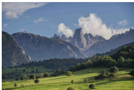
Grandiose Entdeckungsreise von Porto bis Bilbao

Vom Massentourismus noch verschont, stellt Nordspanien eines der schönsten Reiseziele der Iberischen Halbinsel dar. Wir bringen Sie zu echten Geheimtipps! Bei dieser umfassenden Rundreise besichtigen Sie die portugiesische Weinmetropole Porto, geschichtsträchtige Stätten wie Santiago de Compostela, die wildromantische Atlantikküste, die Gebirgsregion Picos de Europa, versteckte Dörfer und die die malerische Küste bis nach Bilbao.